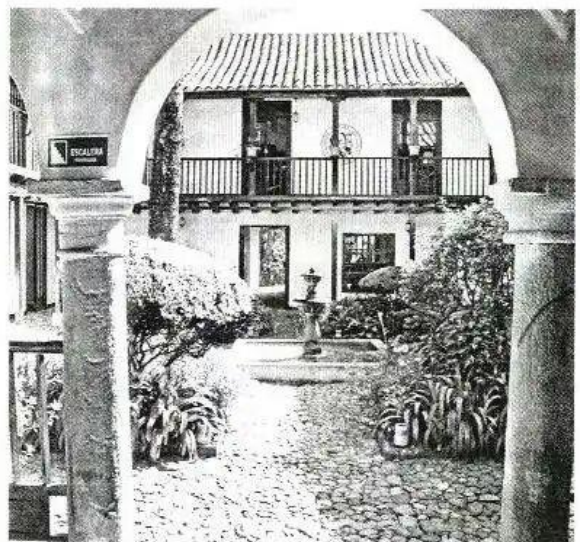
LAS ACTIVIDADES SON ORGANIZADAS por el Instituto Caro y Cuervo y se cumplirán en la sede de Bogotá y en Chía (Cundinamarca).

En este país existe una gran variedad de lenguas nativas definidas, en la Ley 1381, como lenguas en uso, habladas por las comunidades étnicas, tales como las lenguas indígenas, las lenguas criollas de San Basilio de Palenque y del Archipiélago de San Andrés, Providencia y Santa Catalina y la lengua romanés de las kum-