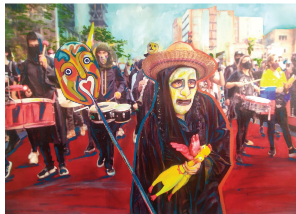
Mayo 5 de 2021. Estudiantes protestan cerca de la Universidad Javeriana en Bogotá durante las marchas en contra del gobierno del presidente Iván Duque

El acceso al patio termina treinta (30) minutos antes de las 5 p.m.