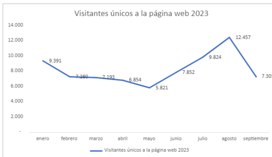
Ilustración 1 Visitantes únicos a página web