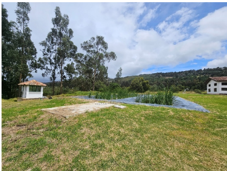
Ilustración 4 Planta de tratamiento aguas residuales sede Yerbabuena