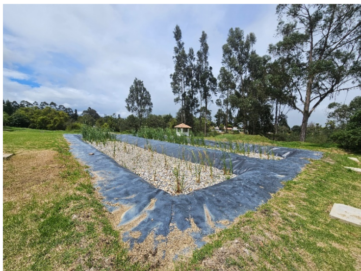
Ilustración 2 Planta de tratamiento aguas residuales